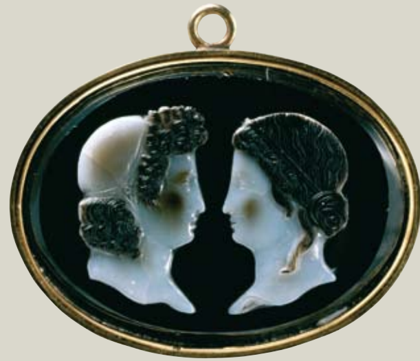
Cameo mit Jüngling und Mädchen Unteritalien, 2. Hälfte 13. Jh.; Wien, Kunsthistorisches Museum

Diese Herrscher, die ganz maßgeblich die historische Entwicklung des hohen Mittelalters prägten und deren Familienname wie kein anderer mit dem Glanz und der Kulturblüte dieser Zeit verbunden ist, entstammten der Dynastie der Staufer. Systematisch hatte dieses Adelshaus Macht, Rang, Territorium und Herrschaft ausgebaut, seit ihm 1079 das schwäbische Herzogtum verliehen worden war. Die Staufer hatten sich als Könige gegen konkurrierende Adelsfamilien durchgesetzt, mit dem Papst um Anerkennung gestritten und waren zu Kaisern des Heiligen Römischen Reiches aufgestiegen.