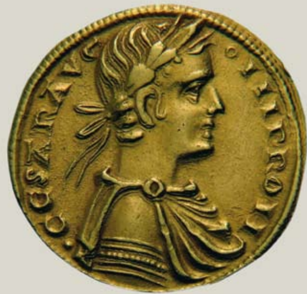
Augustalis Kaiser Friedrichs II. Münzstätte Brindisi, nach 1231; Berlin, Staatliche Museen zu Berlin SPK, Münzkabinett [1]

Es gab eine Zeit, als eine süddeutsche Fürstenfamilie zu den mächtigsten Adelsgeschlechtern Europas zählte. Ihr Herrschaftsbereich erstreckte sich über weite Teile der mittelalterlichen Welt, von der Nord- und Ostseeküste, über die Rhein-Main-Neckar-Region bis in die südliche Provence und vom westlichen Lothringen bis ins östlichste Böhmen. Jenseits der Alpen beanspruchten sie die Macht über Oberitalien und regierten im Süden das Königreich Sizilien. Als Bauherren von Burgen und Pfalzen schufen sie in diesen Regionen beeindruckende, noch heute sichtbare Denkmäler von Macht und Herrschaft. So, wie sie bei den Zeitgenossen Sehnsüchte nach Frieden und Gerechtigkeit weckten, so hofften die Menschen noch Jahrhunderte nach ihrem Ende auf ihre Wiederkehr.