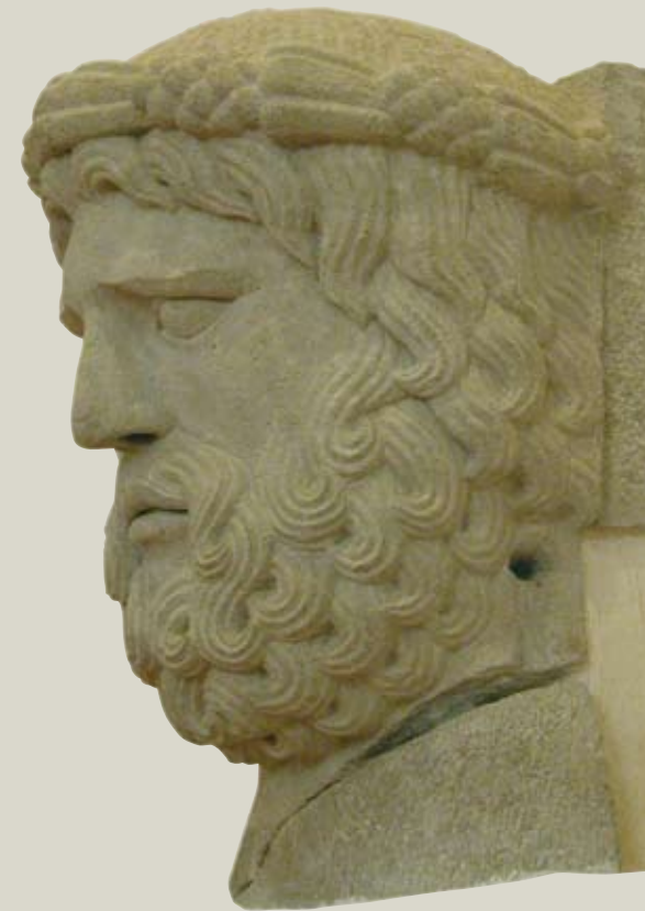
Jupiter vom Brückentor zu Capua 1234–1239; Capua, Museo Provinciale Campano [4]

Das süditalienische Königreich bot als Schmelztiegel der verschiedenen Kulturen zugleich ein Umfeld zur Entfaltung vielfältiger Interessen und breiter Bildung. So ging man davon aus, dass hier die Wiege der Kulturen stehe.