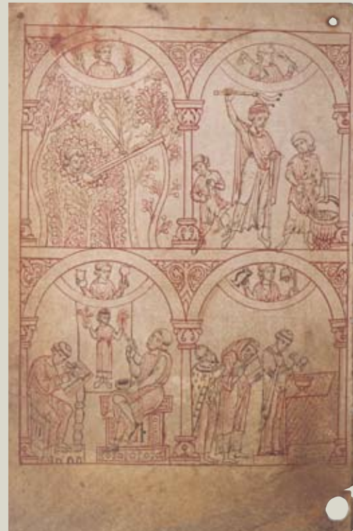
Reiner Musterbuch Rein, Anfang 13. Jh.; Wien, Österreichische Nationalbibliothek [3]

Im Rhein-Main-Neckar-Gebiet hielten sich die Staufer besonders häufig und gerne auf. Entsprechend vielfältig ist hier ihre Hinterlassenschaft bedeutender Baudenkmäler. Nach Otto von Freising, dem Biographen Kaiser Friedrich I. Barbarossas, lag am Oberrhein die größte Kraft des Reiches . In Oberitalien sahen sich die staufischen Herrscher den florierenden, reichen und wohl organisierten Städten, wie Mailand, Cremona oder Pavia, gegenüber. Diese faszinierten in kultureller wie wirtschaftlicher Hinsicht. Wie ein Garten der Wonnen blühe diese Region, meinte Otto von Freising. Im Königreich Sizilien , das seit dem Ende des 12. Jahrhunderts mit dem nordalpinen Reich der Staufer vereint war, konnte hingegen ein ganz auf den Herrscher ausgerichtetes Staatswesen errichtet werden.